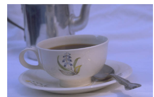
Caption describing picture or graphic.

Once you have chosen an image, place it close to the article. Be sure to place the caption of the image near the image.