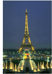
Caption describing picture or graphic.

Much of the content you put in your newsletter can also be used for your Web site. Microsoft Publisher offers a simple way to convert your newsletter to a Web publication. So, when you're finished writing your newsletter, convert it to a Web site and post it.